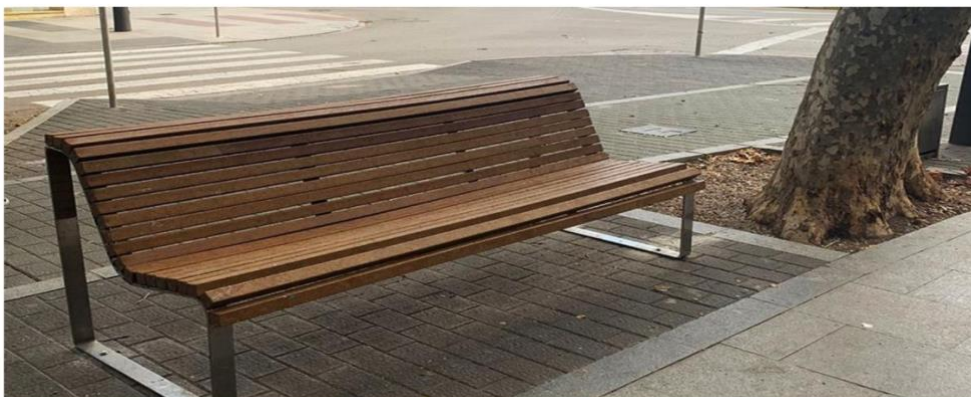
Uno de los primeros bancos con posidonia instalados en el paseo de Oliva.